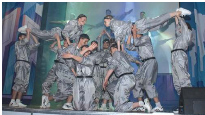
Бойцы Штаба студенческих отрядов НГАСУ (Сибстрин) на танцевальном баттле на слёте-фестивале «Весенний старт».