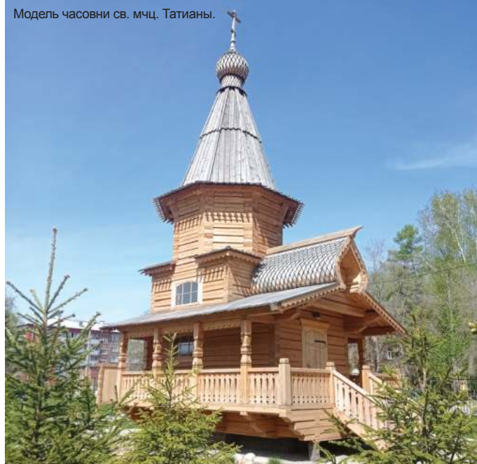
Модель часовни св. мчц. Татианы.

Деревянная часовня святой Татианы, покровительницы студентов, на территории Сибстрина – это тоже наш совместный проект. Часовня выполняет несколько функ-