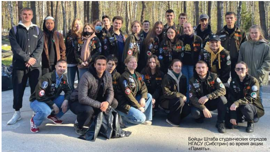
Бойцы Штаба студенческих отрядов НГАСУ (Сибстрин) во время акции «Память».

Наши студенческие отряды никогда не стоят на месте: добрые дела для других и активное весёлое время для себя – они успевают всё!