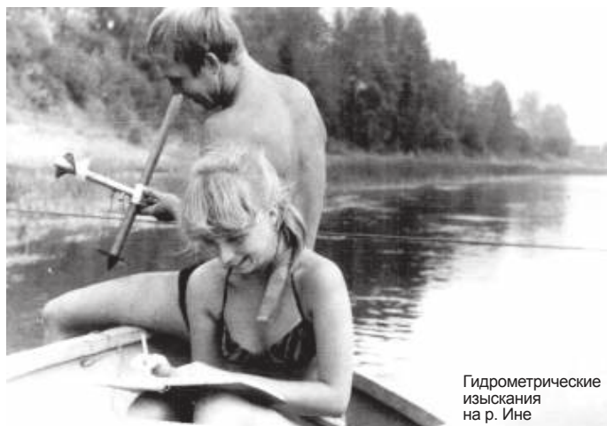
Гидрометрические изыскания на р. Ине