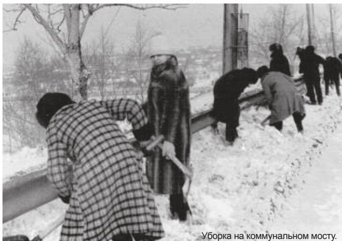
Уборка на коммунальном мосту.

Седьмой семестр, восьмой – и опять практика, уже производственная. Почти специ-