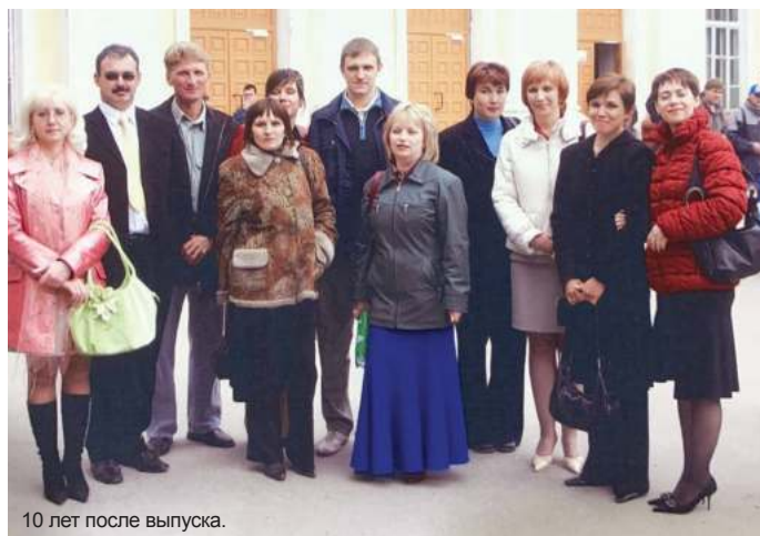
10 лет после выпуска.